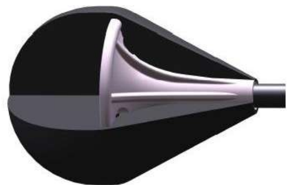
Sicherheitskopf des IDV-LARP-Pfeils

Trotz des großen Funktionsumfangs ist die Einlernphase für neue Mitarbeiter sehr kurz: „Die intuitive Menüführung hilft ungemein. Selbst unsere Auszubildenden lieferten bereits in der ersten Woche verwertbare Ergebnisse ab. Im Vergleich zu anderen CAD-Systemen komme ich mit spürbar weniger Mausklicks und Mausbewegungen aus. Selbst in der 2D-Funktion ist die Bedienung schneller und einfacher. Ich mache diese Erfahrung immer wieder, da ich bei Geschäftspartnern durchaus Einblicke in unterschiedlichste CAD-Systeme bekomme.“