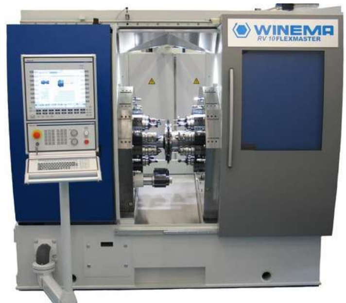
WINEMA RV 10 Flexmaster: Rundtaktmaschine mit einer Stückleistung von 4-50 pro Minute

Während sich andere Maschinenhersteller auf eine Bearbeitungsart beschränken, finden bei WINEMA fast zwei Dutzend auf engstem Raum statt, die immer gleichzeitig in einem Arbeitstakt erfolgen, sowohl axial als auch radial. Die Kunden freut es, denn sie produzieren mit WINEMA Maschinen äußerst wirtschaftlich, schnell und zuverlässig hohe Stückzahlen. Das Rohmaterial wird dabei auf einer Seite als Stange oder Coil zugeführt. In der Maschine befindet sich ein Schaltteller mit 8, 9 oder 12 Spannbacken, welcher von Bearbeitungsstation zu Bearbeitungsstation taktet. Die mechanische Belastung aller Maschinenkomponenten ist enorm und muss hochpräzise für millionenfache Schaltvorgänge abgestimmt sein. Die Besonderheit der Flexmaster-Maschinen liegt darin, dass die Werkzeugbestückung sehr leicht vorzunehmen ist. Eine einfach zu bedienende Steuerung, wie die Bosch Rexroth MTX, runden das Angebot in Verbindung mit diversen Teile-Abfuhrtechniken zum Sortieren, Reinigen, Entgraten etc. ab.